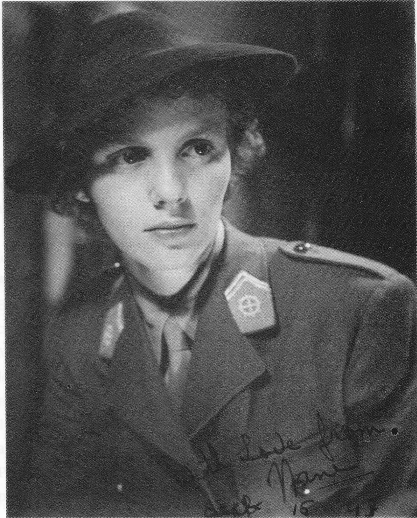
La 8 iulie 1944 a debarcat la Napoli, în Italia, alături de trupele aliate. Între 27 august și 1 septembrie 1944 s-a aflat pe mare, debarcând în Franța la 2 septembrie. După eliberarea Franței, Regenera